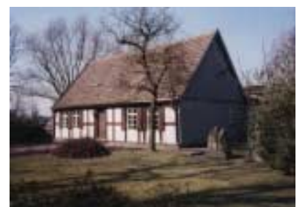
Ehm-Welk-Museum in Angermünde