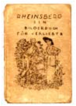
Kurt Tucholskys Rheinsberg-Novelle