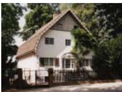
Brecht-Weigel-Haus in Buckow

Die Mark in der zweiten Hälfte des 20. Jahrhunderts