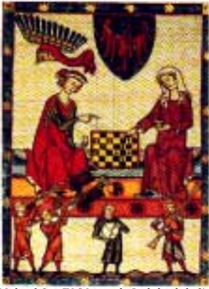
Markgraf Otto IV. (Manessische Liederhandschrift)