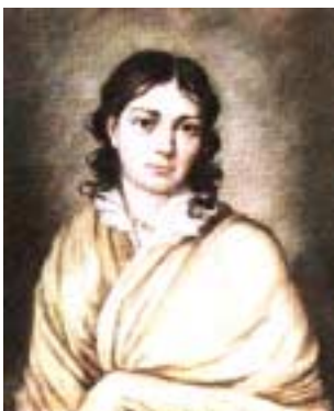
Bettina von Arnim