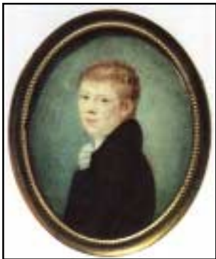
Heinrich von Kleist

Das Land Brandenburg besitzt eine reiche literarische Tradition: Leben und Werk von bedeutenden Autoren und Autorinnen wie Bettina und Achim von Arnim, Heinrich von Kleist, Theodor Fontane, Gerhart Hauptmann, Richard Dehmel, Peter Huchel und Hermann Kasack sind mit der historischen Kulturlandschaft Brandenburg verbunden.